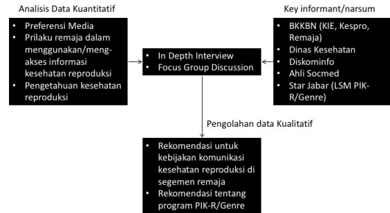
Penelitian Tahap 2 Pengolahan data Kualitatif

Metode penelitian deskriptif adalah salah satu metode penelitian yang banyak digunakan pada penelitian yang bertujuan untuk menjelaskan suatu kejadian. Seperti yang dikemukakan oleh Sugiyono (2011) “penelitian deskriptif adalah sebuah penelitian yang bertujuan untuk memberikan atau menjabarkan suatu keadaan atau fenomena yang terjadi saat ini dengan menggunakan prosedur ilmiah untuk menjawab masalah secara aktual”. Sedangkan, Sukmadinata (2006) menyatakan bahwa metode penelitian deskriptif adalah sebuah metode yang berusaha mendeskripsikan, menginterpretasikan sesuatu, misalnya kondisi atau hubungan yang ada, pendapat yang berkembang, proses yang sedang berlangsung, akibat atau efek yang terjadi atau tentang kecenderungan yang sedang berlangsung.